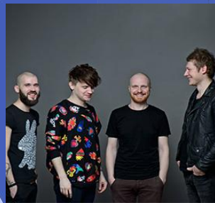
/ grupa Sansara