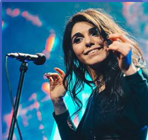
/ grupa AloeVera