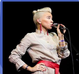
/ dziedātāja Varvara Vizbora